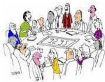
CONSELHO DE CLASSE

https://oplum2.wordpress.com/2012/04/20/vem-ai-nosso-1o-conselho-de-classe-do-ano